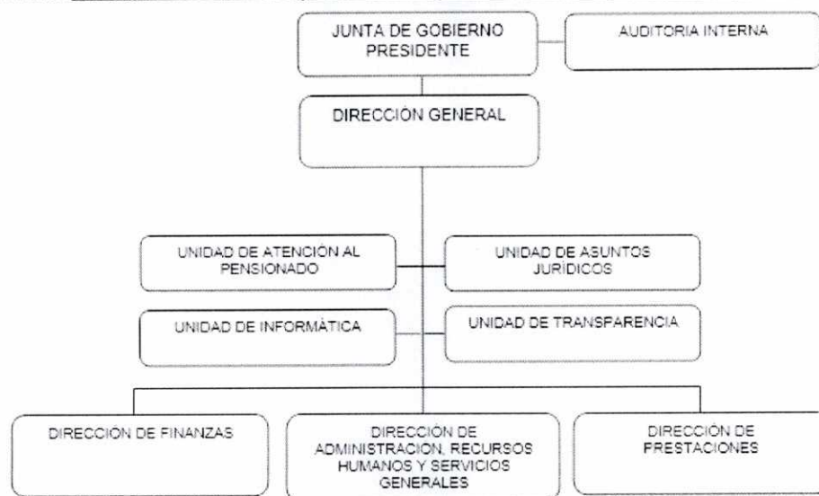
Organigrama General: Dirección de Pensiones para los Trabajadores del Estado de Coahuila (DIPETRE).

Sección 38 del Sindicato Nacional de los Trabajadores de la Educación, uno por la Universidad Autónoma de Coahuila, uno por el sindicato de la misma; la administración de la dirección de pensiones se llevará a cabo por un Director General/Titular de organismo, Directores de las unidades administrativas, Subdirectores y demás personal técnico de apoyo.